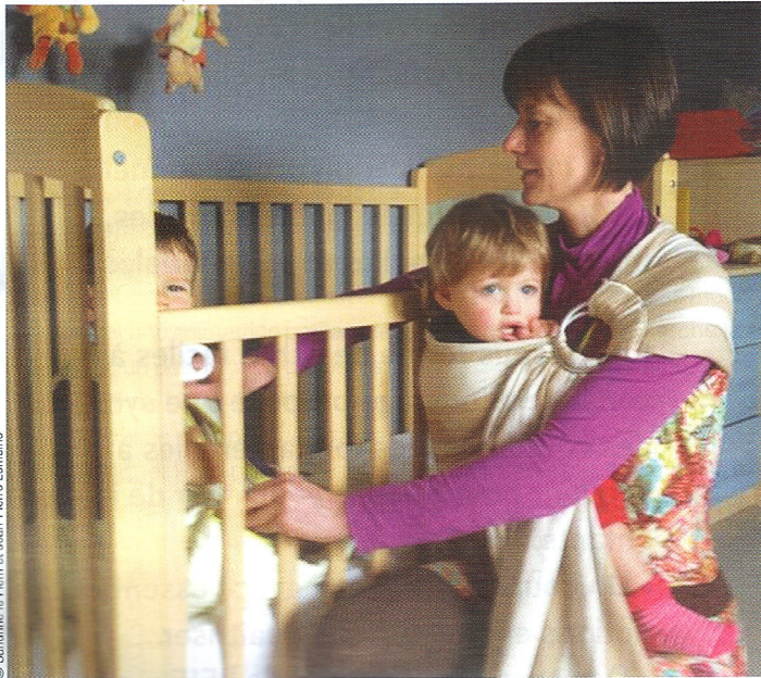
Figure 2. Portage en sling et lever de sieste chez une assistante maternelle.